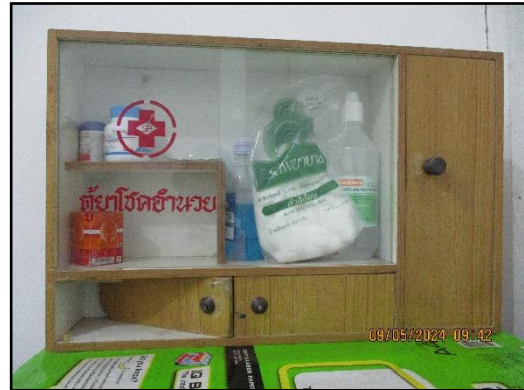
ภาพที่ 2.16 ตู้ปฐมพยาบาลเบื้องต้น ประจำโครงการ