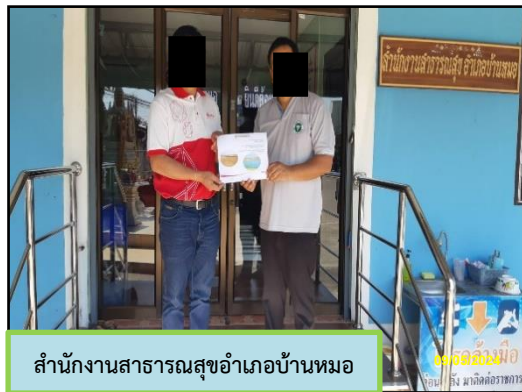
สำนักงานสาธารณสุขอำเภอบ้านหมอ