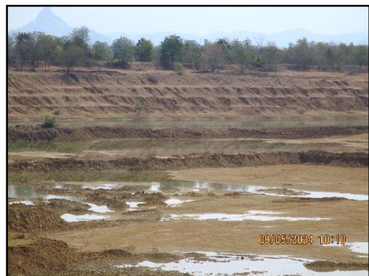
ภาพที่ 2.19 การเปิดหน้าเหมืองในลักษณะชั้นบันได