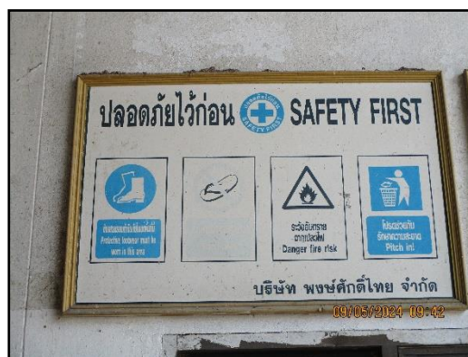
ภาพที่ 2.26 ป้ายเตือนบริเวณที่มีความเสี่ยงและกำหนดให้สวมใส่อุปกรณ์ป้องกันอันตรายส่วนบุคคล