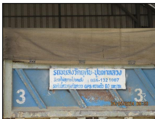
ภาพที่ 2.13 รถบรรทุกแร่ที่มีการติดชื่อโครงการ และหมายเลขโทรศัพท์