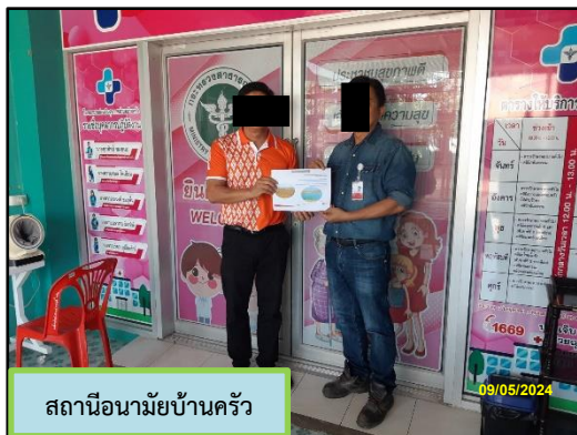
สถานีอนามัยบ้านครัว