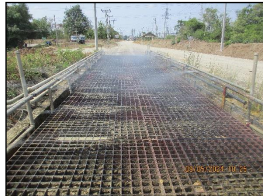
ภาพที่ 2.5 บ่อล้างล้อรถบรรทุกในช่วงถนนคอนกรีตของเส้นทางขนส่งแร่