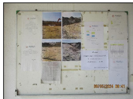
ภาพที่ 2.10 บอร์ดประชาสัมพันธ์ความรู้ต่างๆ ภายในพื้นที่โครงการ