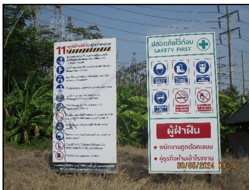
ภาพที่ 2.14 นโยบายความปลอดภัยอาชีวอนามัย และสิ่งแวดล้อมในการทำงาน