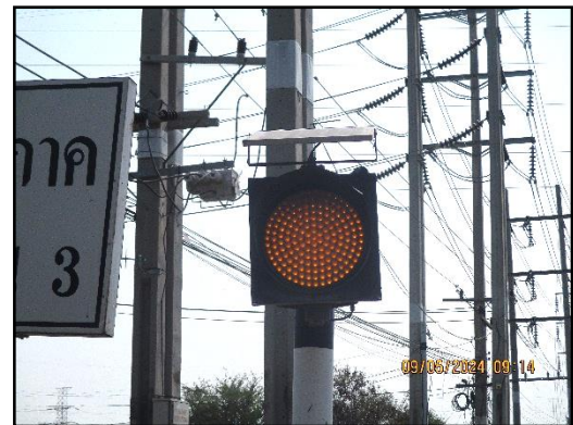
ภาพที่ 2.11 ป้ายจราจร และสัญญาณไฟให้ชะลอความเร็วบริเวณช่วงก่อนเลี้ยวเข้า-ออก พื้นที่โครงการ