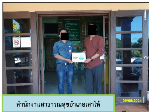
สำนักงานสาธารณสุขอำเภอเสาไห้