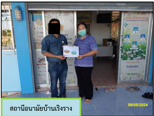
สถานีอนามัยบ้านเริงราง