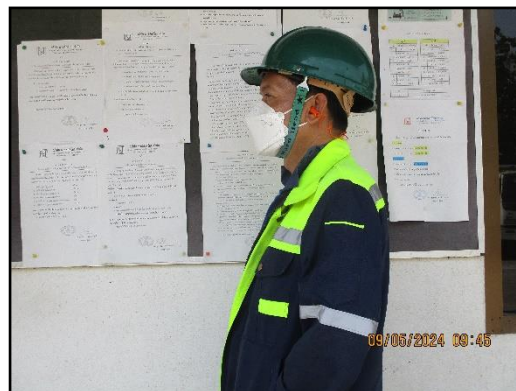
ภาพที่ 2.25 พนักงานสวมใส่อุปกรณ์ป้องกันอันตราย