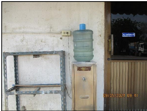
ภาพที่ 2.17 ตู้บริการน้ำดื่มภายในพื้นที่ โครงการ