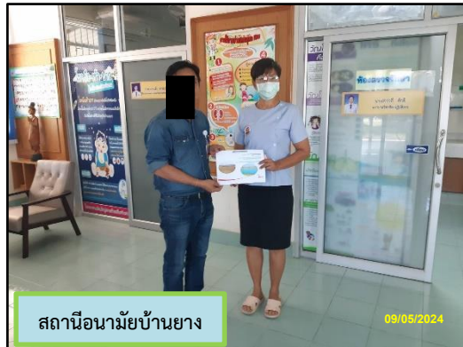
สถานีอนามัยบ้านยาง