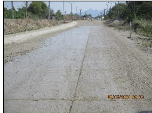
ภาพที่ 2.6 สภาพเส้นทางขนส่งแร่ (ส่วนบุคคล) ช่วงก่อนขึ้นสู่ทางหลวง