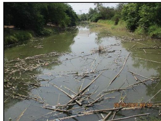
ภาพที่ 2.8 คลองห้วยแร่