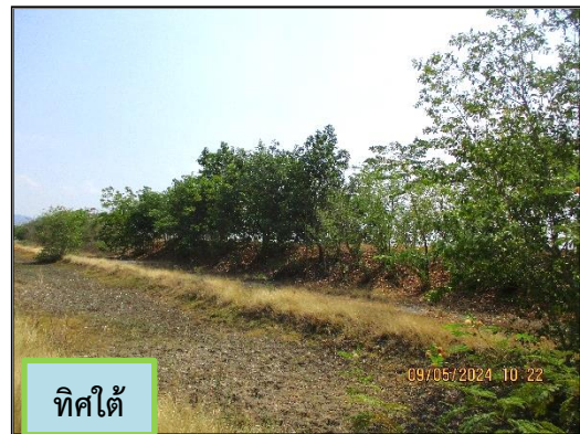
ภาพที่ 2.4 ค้นทำนบดินของพื้นที่โครงการ