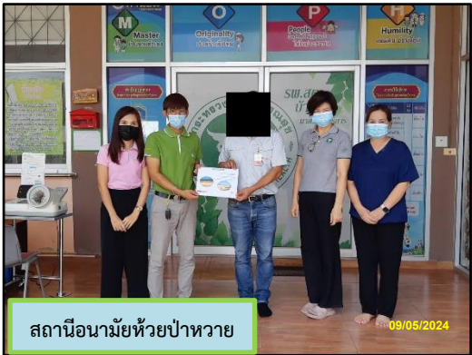
สถานีอนามัยห้วยป่าหวาย