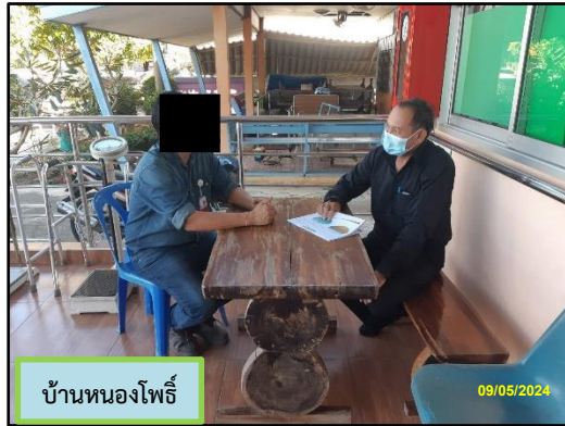
บ้านหนองโพธิ์