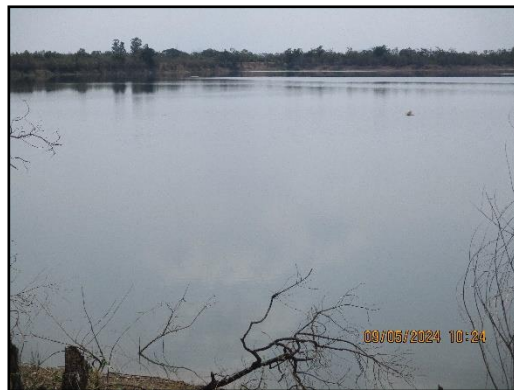
ภาพที่ 2.20 จุดรับน้ำเพื่อนำมาฉีดพรมถนนลำเลียงแร่