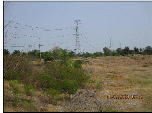
ภาพที่ 2.3 การเว้นระยะห่างจากแนวสายไฟ