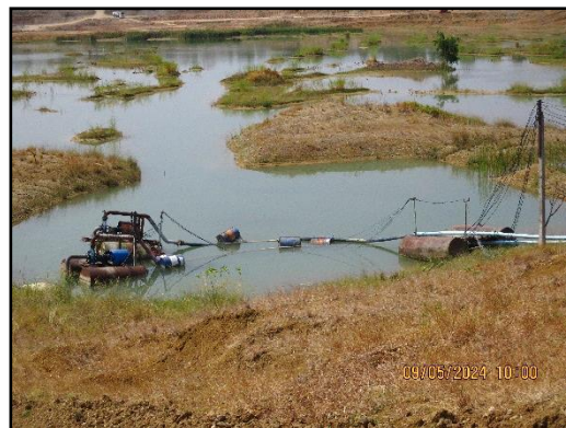
ภาพที่ 2.23 บ่อรวบรวมน้ำ (Sump)