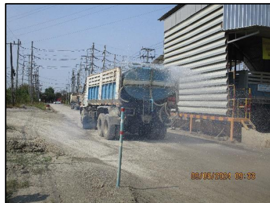
ภาพที่ 2.21 รถบรรทุกน้ำคอยฉีดพรมถนนภายในพื้นที่โครงการ