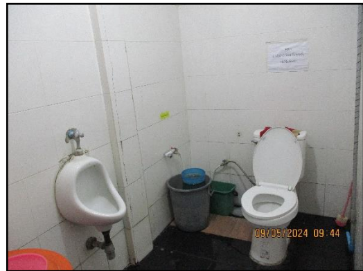
ภาพที่ 2.18 สุขาภายในพื้นที่โครงการ