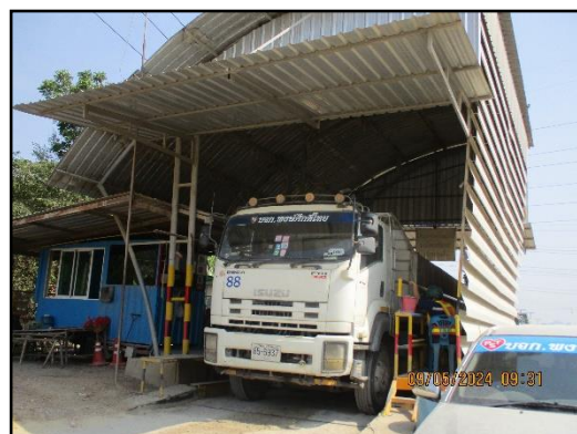
ภาพที่ 2.24 ด้านซังน้ำหนักรถบรรทุกขนส่งแร่