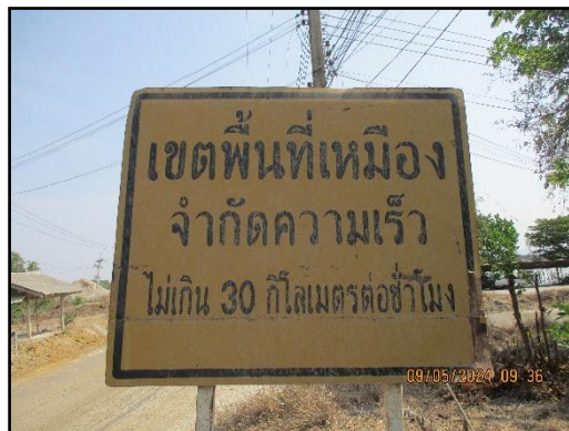
ภาพที่ 2.12 ป้ายจำกัดความเร็วไม่เกิน 30 กิโลเมตร/ชั่วโมง