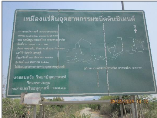
ภาพที่ 2.15 ป้ายประทานบัตร