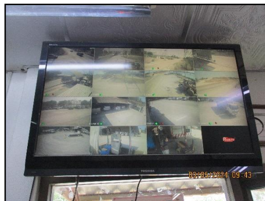
ภาพที่ 2.27 การติดตั้งกล้องวงจรปิดภายในพื้นที่โครงการ