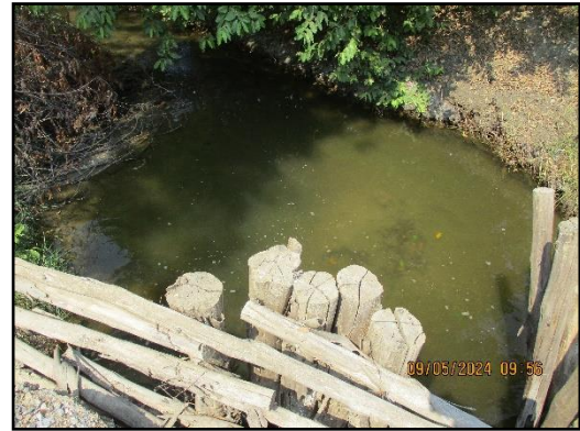
ภาพที่ 2.9 คูระบายน้ำด้านนอกคันทำนบ